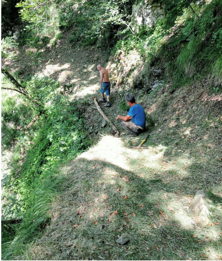
durante i lavori