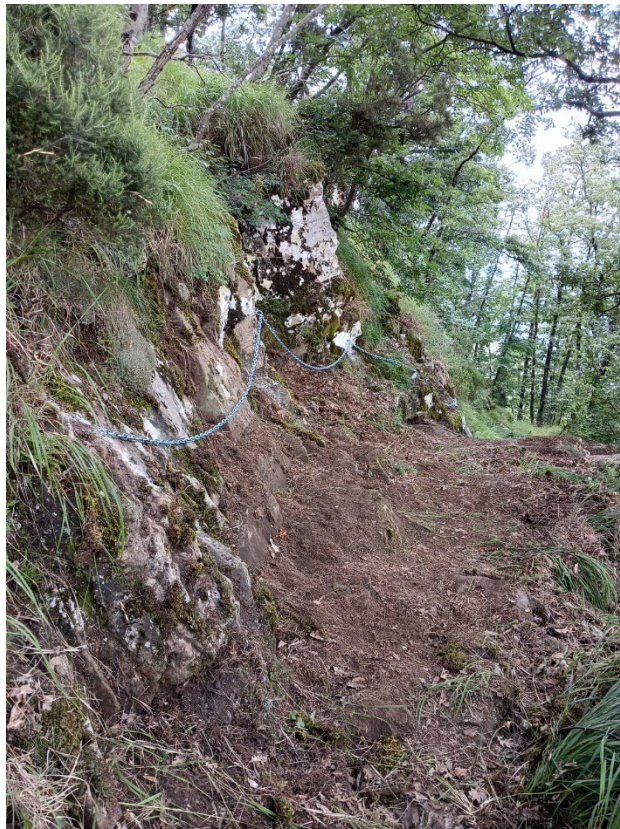
post operam di altro tratto su cui si è intervenuti