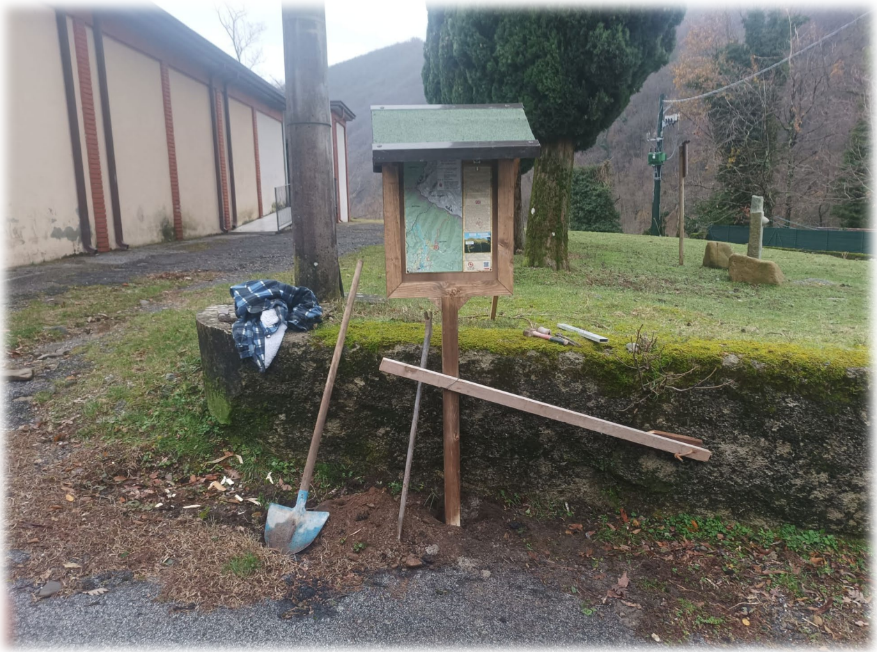
Il posizionamento di una bacheca in località Treschietto, di fronte all'Ostello "La Stele"