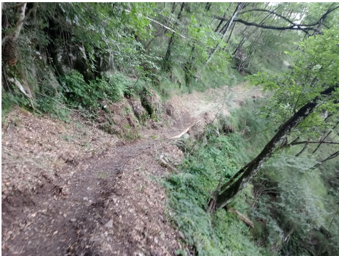
Durante i lavori