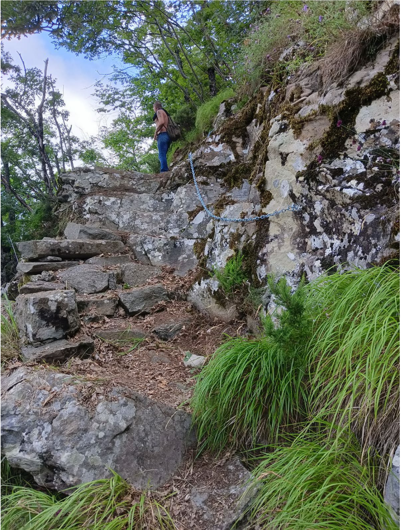
Post operam : rimozione vecchia staccionata in legno pericolosa e dei sostegni scatolari in ferro. Posa in opera di catena da utilizzare sia per la salita che per la discesa