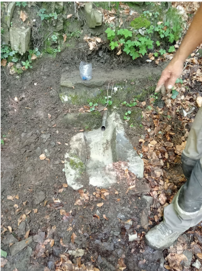
durante i lavori di recupero / riqualificazione